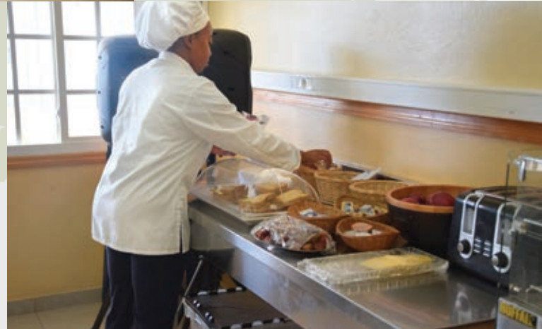
Het schoolontbijt is beschikbaar voor alle leerlingen