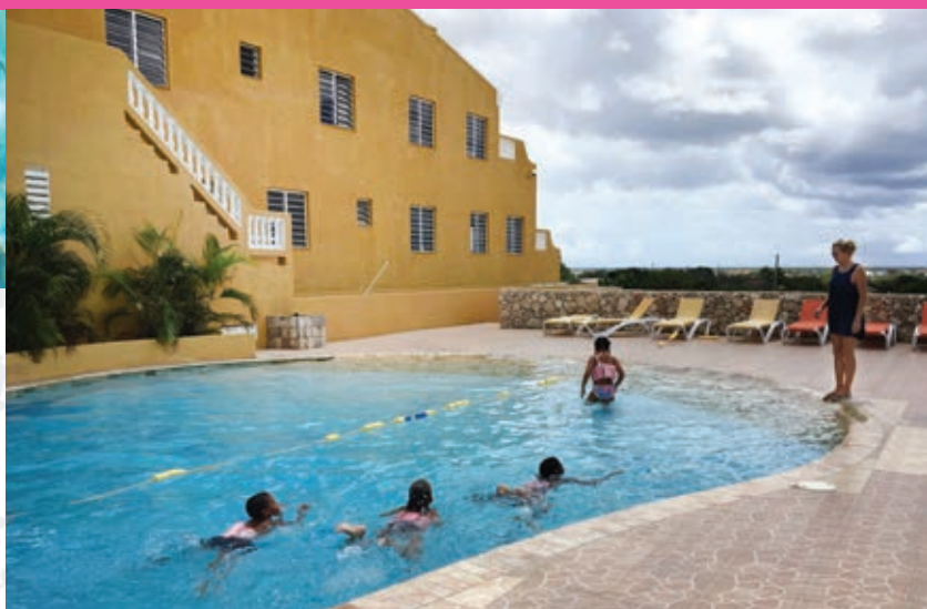
Zwemles op Bonaire

Al sinds november 2016 organiseren de Sint Eustatius Sports Facility Foundation (SSFF) en de Sint Eustatius Swimming Association (SESA) zwemlessen voor leerlingen van de groepen 3. Na de orkaanperiode in september 2017 wordt er een inhaalslag gemaakt. De leerlingen van groep 4 en 8 krijgen nu ook les, zodat in 2018 alle kinderen die de basisschool afronden, hun zwemdiploma A hebben. Veiligheid en kwaliteit staan in dit project voorop.