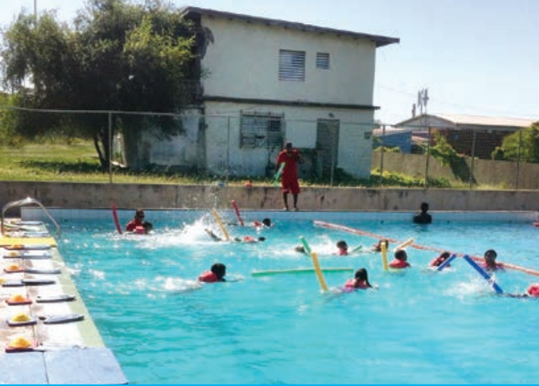
Zwemles op Sint Eustatius

‘HET LIJKT WEL OF WIJ DE KINDEREN ELKE WEEK EEN NIEUW CADEAUTJE GEVEN, ZO VROLIJK ZIJN ZE WANNEER ZE HIER ARRIVEREN.’